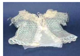
Dragt som bruges ved Brit Milah, omskærelse af drengbørn. Stammer fra Fredericia.