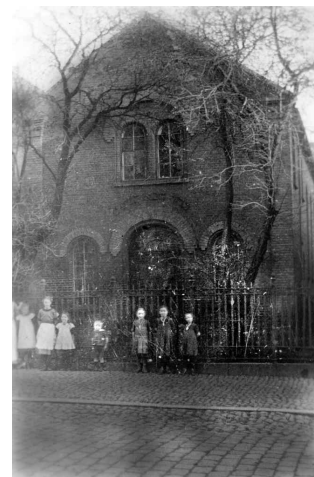
Børn foran Synagogen i Fredericia.

Begravelsespladsen eksisterer stadig i dag, og er det eneste synlige bevis på jødernes fortid i byen. Det er ifølge jødisk tradition forbudt at nedlægge en jødisk grav og både i Fredericia og i andre danske byer, der har haft jødiske menigheder, finder man de jødiske begravelsespladser bevaret. Museerne i Fredericia fører i dag tilsyn med begravelsespladsen i Fredericia.