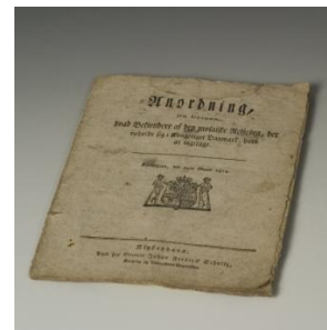
Anordningen af 29. marts 1814 gav jøder stort set de samme rettigheder som andre borgere i Danmark.