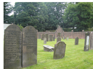
Begravelsespladsen i Fredericia.