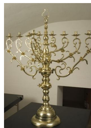
Chanukkah-stage fra Fredericia, fremstillet i 1779 til byens synagoge. Kan nu ses på Dansk Jødisk Museum.