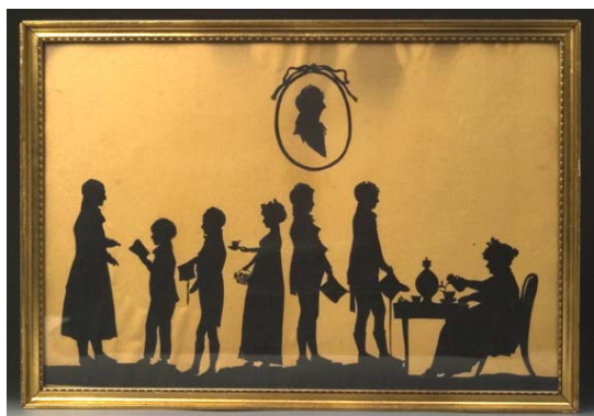
Papirklip af jødisk familie fra Randers

jødisk indvandring fra Tyskland og fra Østeuropa.